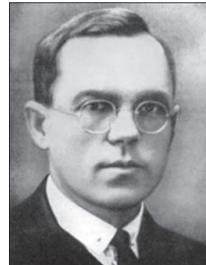
Н. Д. Кондратьев

В 1916 г. в Российской империи насчитывалось уже более 14 тысяч кредитных кооперативов с общим числом пайщиков более 8 млн. В начале XX века Россия занимала ведущее место в мире по численности кредитных кооперативов и числу пайщиков. В ходе первой мировой войны и, особенно, в период революционных преобразований движение кредитных союзов было радикально подорвано, однако существовало вплоть до 30-х годов.