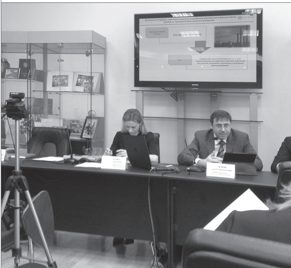
Выступление первого заместителя председателя ЦБ РФ Сергея Швецова.